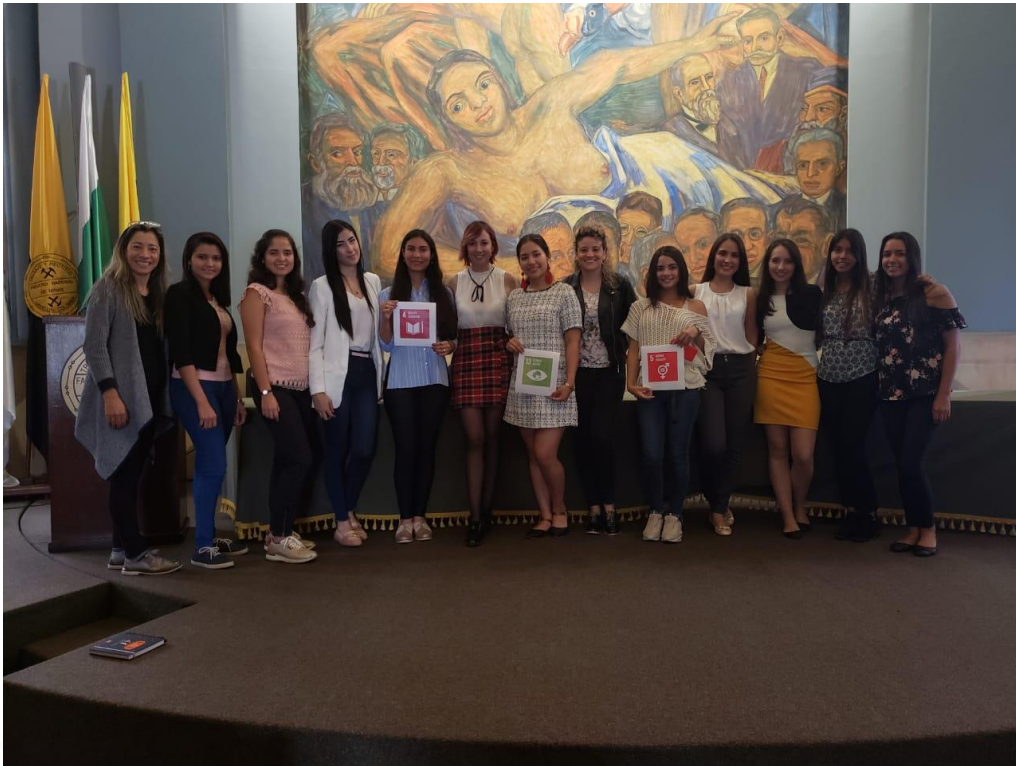
Figura 1. Conversatorio desarrollado en la Facultad de Minas, Universidad Nacional de Colombia, Sede Medellín.

A continuación, este documento hará un recuento por todos los programas y objetivos desarrollados durante por la organización durante el año 2019.